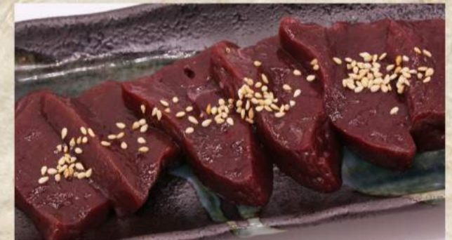
上レバー ¥860 牛レバー ¥640