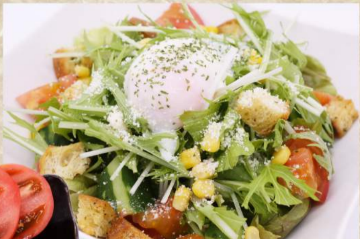
温玉シーザーサラダ ¥530 チョレギサラダ ¥530 とうふサラダ ¥530