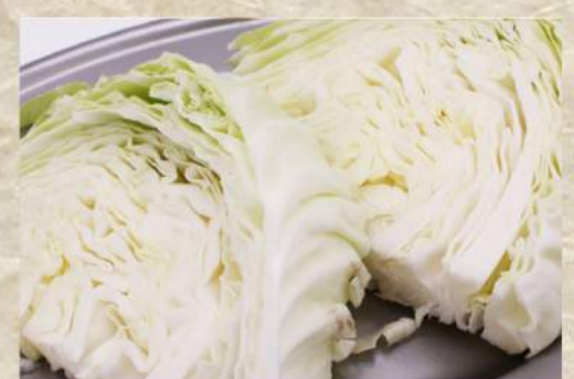
キャベツ焼き ¥390 玉ねぎ焼き ¥390