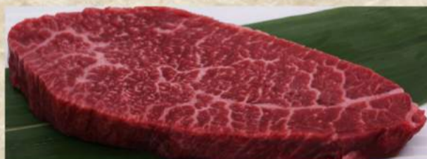
極厚赤身ステーキカット ¥1,850