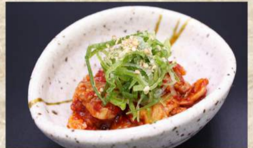
チャンジャ ¥420 チャンジャチーズ ¥480 ナムル盛り合わせ ¥530