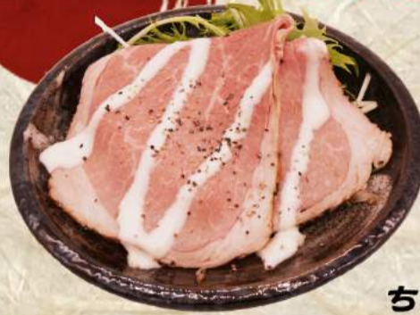
ちょこっとローストビーフ ¥420