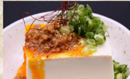
坦々奴 ¥370 冷奴 ¥310 枝豆 ¥310