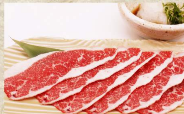
おろしポン酢の焼しゃぶ ¥1,300 赤身肉のすき焼き風(まんげつ濃厚卵添え) ¥1,300