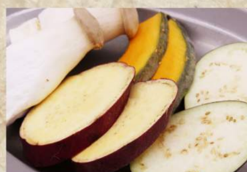
焼き野菜盛り合わせ ¥440 エリンギ ¥390