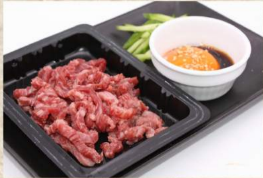
国産牛ユッケ (まんげつ濃厚卵添え) ¥970