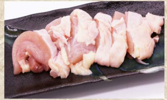
鶏もも ¥440 鶏せせり ¥440