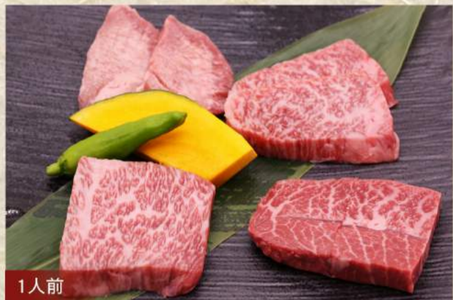
1人前 希少部位お試しセット ¥2,180 その日のおすすめ希少部位4種盛りのセット