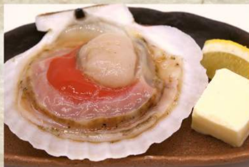
片貝付ホタテ 1個 ¥500