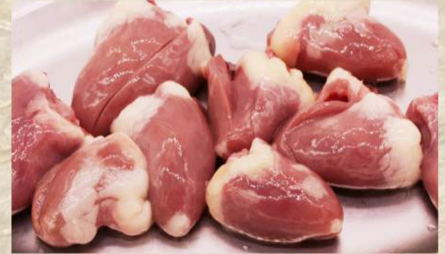
鶏こころ ¥440 鶏ナンコツ ¥470 鶏皮 ¥310