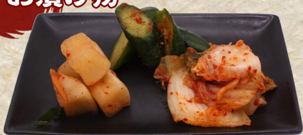
青山さん家のキムチ盛り合わせ ¥640 青山さん家のキムチ(白菜) ¥420 青山さん家のカクテキ(大根) ¥420 青山さん家のオイキムチ(きゅうり) ¥420