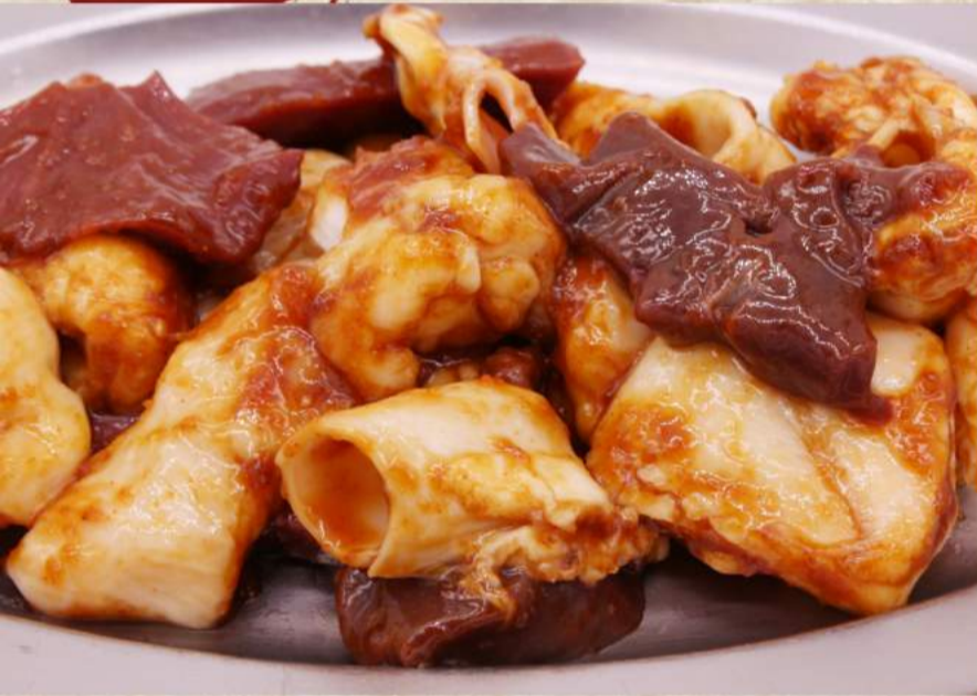
ホルモンミックス盛 ¥860 ホルモン4種盛 ¥640