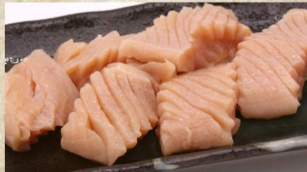
上ミノ ¥640 牛ハツ ¥640