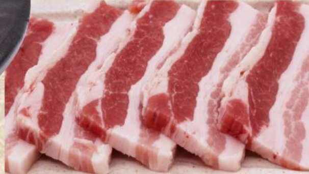
オインク豚バラ肉 ¥440 オインク豚トロ ¥440