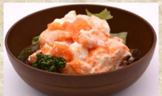
めんたいポテトサラダ ¥370 坦々ポテトサラダ ¥370 ポテトサラダ ¥310