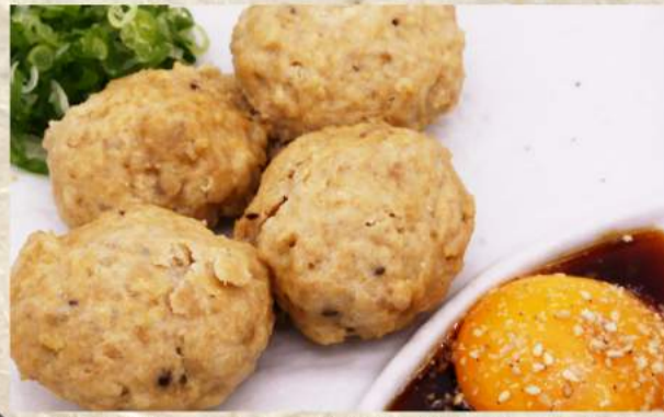
自家製つくね(軟骨入り) ¥440 ソーセージ ¥440 NEW! 厚切りベーコン ¥530