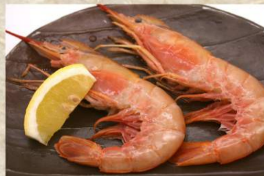
有頭大エビ 2尾 ¥550