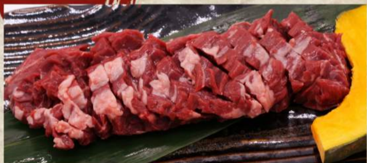
極厚ハラミステーキカット ¥1,850 極厚カルビステーキカット ¥1,850