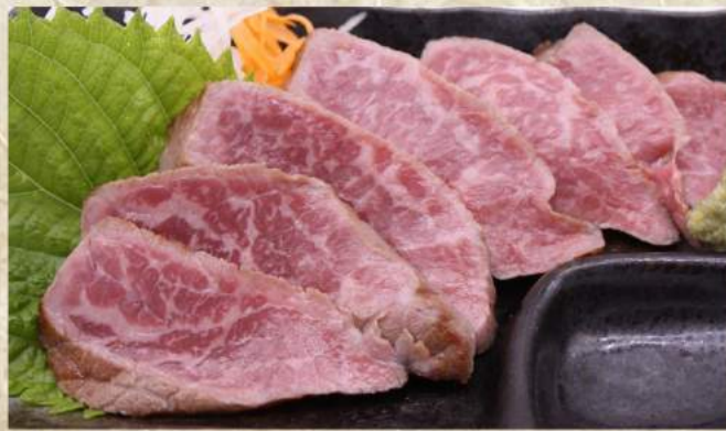
刺身風 赤身レアステーキ ¥1,320