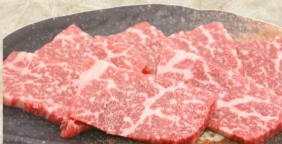
黒毛和牛たけ家ロース ¥530