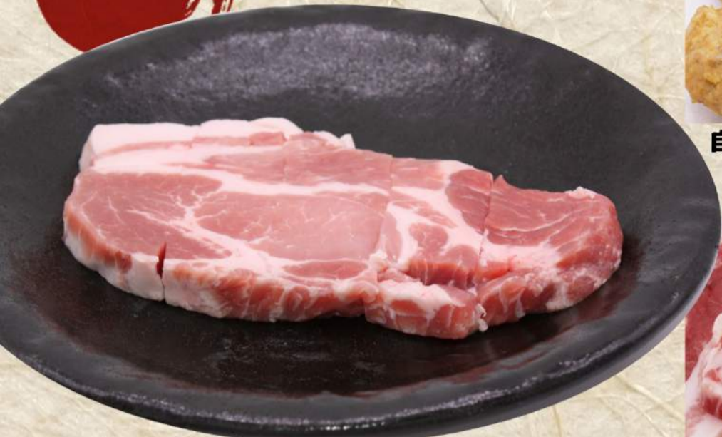
オインク豚厚切り肩ロース ¥550