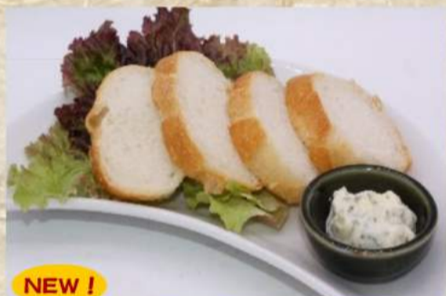
NEW! ガーリックトースト ¥330 コーンバター ¥440 どて煮 ¥370 どて豆腐 ¥530