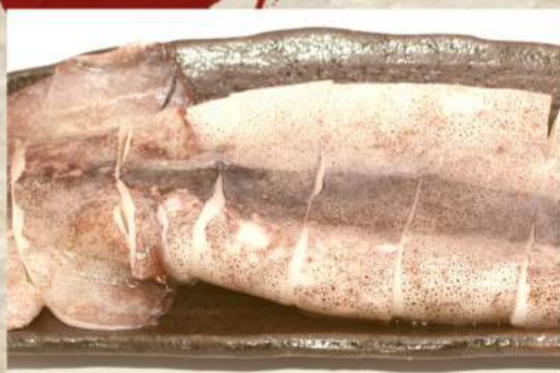
いか 1杯 ¥440