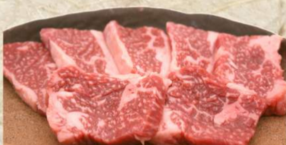
黒毛和牛たけ家カルビ ¥530