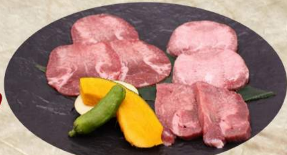
NEW! 牛タン3種盛り ¥1,760 (和牛タン・上タン・タンスライス)