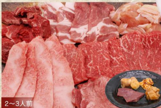
2~3人前 スペシャルセット ¥5,040 上カルビ・上ロース・たけ家ハラミ・鶏もも肉 上タン・厚切り豚肩ロース・ホルモン盛り合わせ