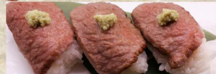
炙り霜降り肉寿司 3貫 ¥1,080