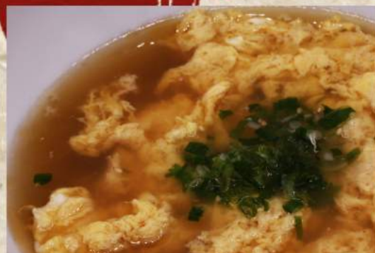
ふわふわたまごスープ ¥330 わかめスープ ¥330 みそ汁 ¥170