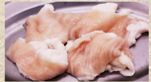
牛ホルモン ¥530 牛上ホルモン ¥660 丸コロホルモン ¥640