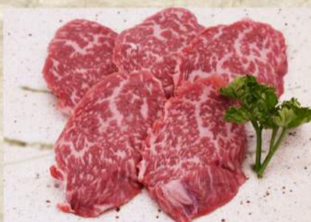
上ロース ¥860 上カルビ ¥860