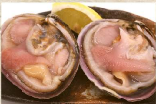
大アサリ 2個 ¥550