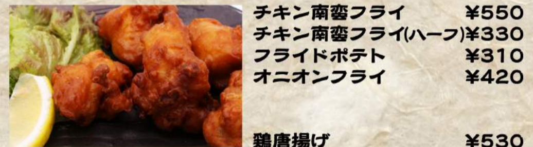
チキン南蛮フライ ¥550 チキン南蛮フライ(ハーフ) ¥330 フライドポテト ¥310 オニオンフライ ¥420 鶏唐揚げ ¥530