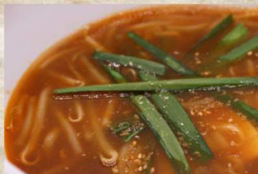
ピリ辛豆腐スープ ¥480 テールスープ ¥1,080