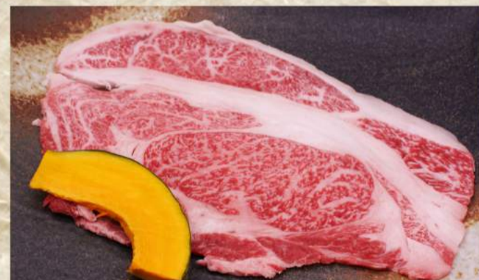
リブロース大判炙り焼き ¥2,070